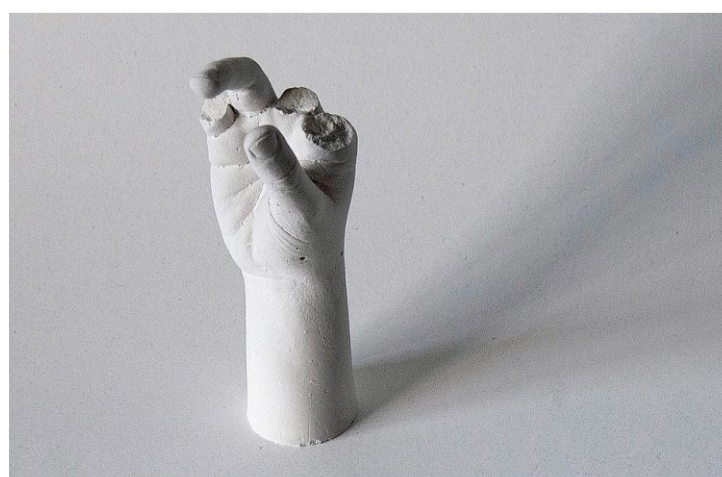
Gipsabdruck einer Hand, der einige Finger fehlen.

Welche Auswirkungen hat der Lockdown auf die Kreativität? Was treibt die Berner Künstlerinnen und Künstler derzeit um? In dieser Serie blicken wir in ihre Ateliers Ausstellungen: Galerie Christophe Guye in Zürich: 5. Mai – 28. August 2021. Freiluftausstellung im Parc de la Torma, Monthey: bis 2022